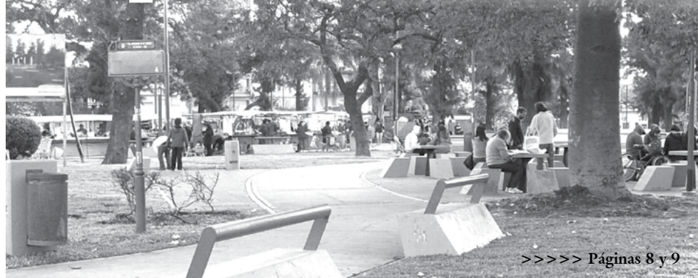
>>>> Páginas 8 y 9

Reclamo vecinal por las obras en la plaza de Pappo "Recuperar la plaza y las calles del barrio es recuperar la vecindad"